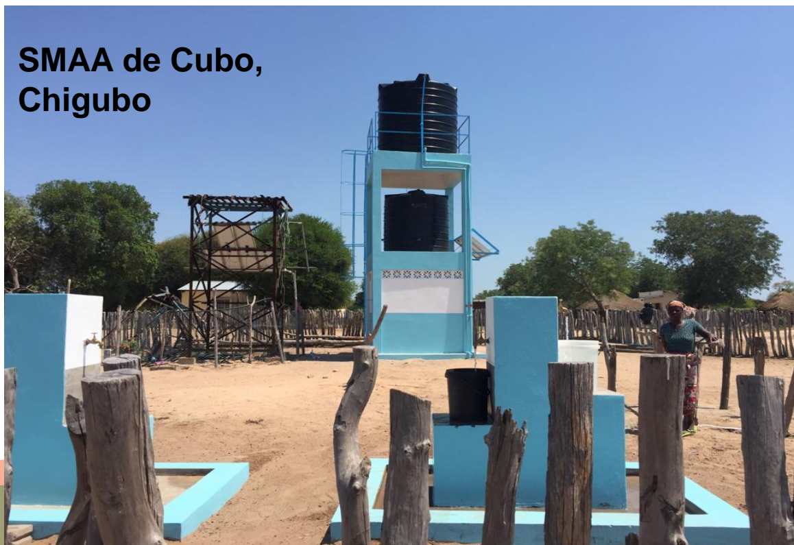
SMAA de Cubo, Chigubo