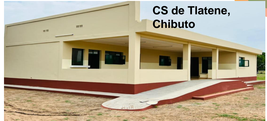
CS de Tlatene, Chibuto