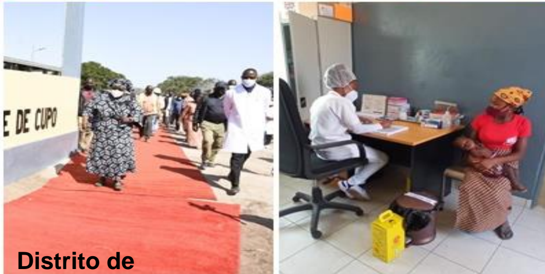
Distrito de Funhalouro